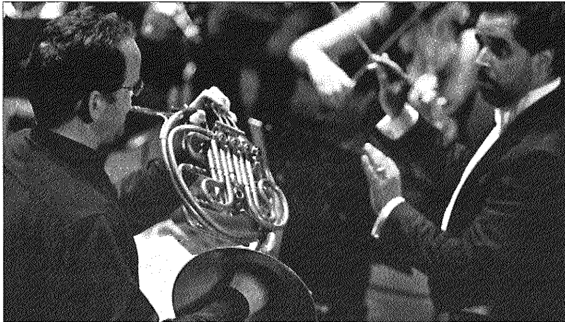
Orquestra Clássica do Sul é um dos agrupamentos que deverão ser envolvidos neste programa