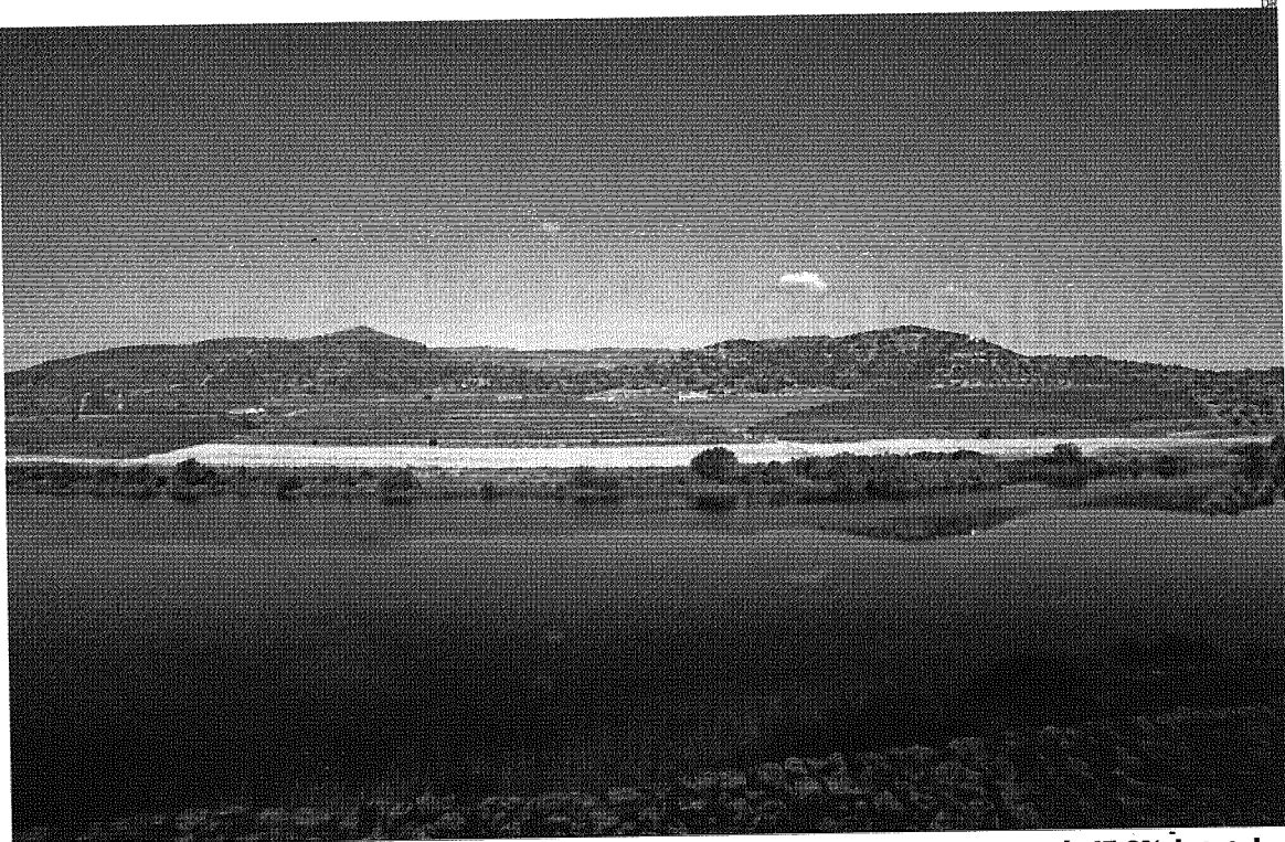
Portugal tem no turismo a sua maior atividade económica exportadora, representando 15,3% do total das exportações de bens e serviços nacionais