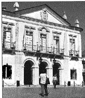
Câmara Municipal de Faro

na reunião da câmara que se realiza na próxima terça-feira, dia 7, às 16h00. A verba a investir deriva do saldo positivo (mais de cinco milhões) das contas da autarquia em 2015. O executivo pretende aplicar cerca de 4,3 milhões de euros em obras nas estradas, infraestruturas e equipamentos públicos do concelho. ●J.M.G.