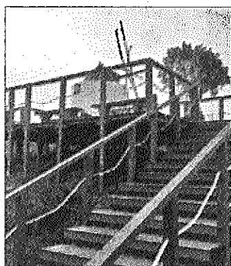
Moinho de Odeceixe valorizado

A Junta de Freguesia de Odeceixe, promotora da obra, está a proceder à plantação de medronheiros e plantas aromáticas e concluirá, em breve, um acesso ao miradouro. ●A.P.