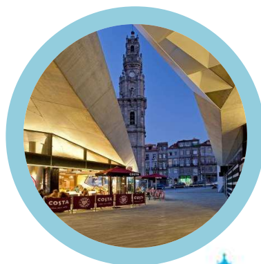
Passeio dos Clérigos Porto