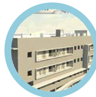
Residência para 3ª Idade Trofa