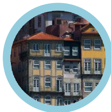
Praça da Ribeira Porto