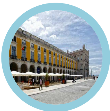
Terreiro do Paço Lisboa