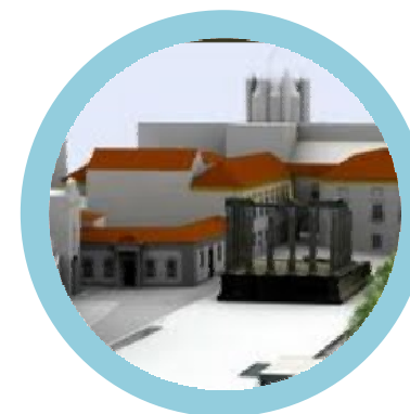
Fundação Eugénio de Almeida Évora