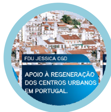
Fundo Cidades de Portugal Coimbra