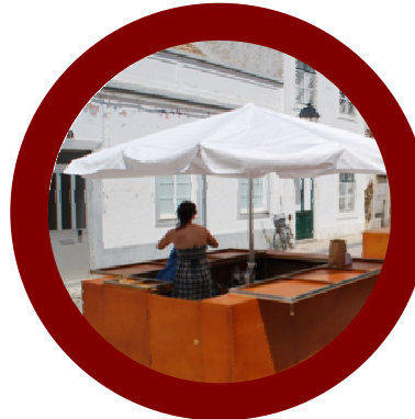
Comércio VR Santo António