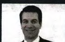
CARLOS SÁ CARNEIRO