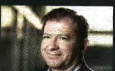
ADOLFO BORRERO VILLALÓN