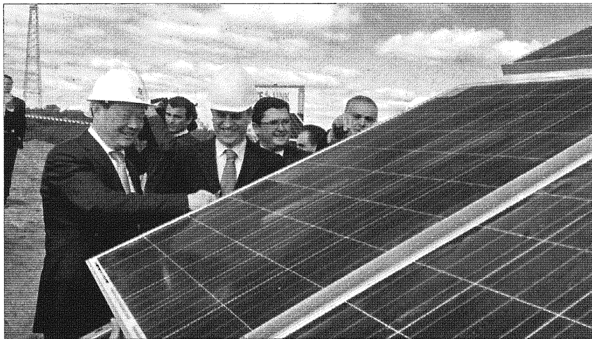
Cerimónia de apresentação da central fotovoltaica decorreu ontem com o ministro da Economia, Manuel Caldeira Cabral

O governante considerou ainda que a central – que vai ter uma área de implantação de 430 hectares num terreno de 1300 hectares, na freguesia de Vaqueiros – dá corpo a “uma