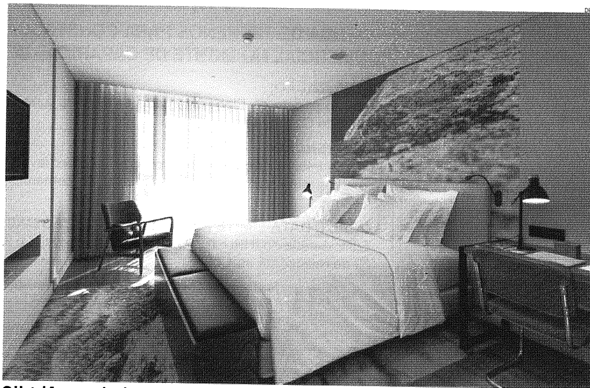
O Hotel Azor resulta da reconversão do antigo hotel Príncipe do Mónaco, em São Miguel (Ponta Delgada), e será inaugurado em junho

este projeto num patamar elevado de reconhecimento internacional” e “para fazer deste resort um destino de referência”.