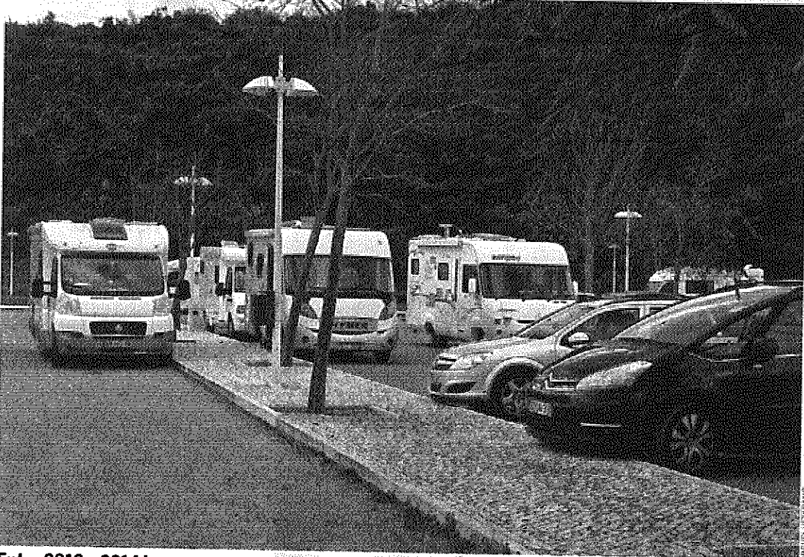
Entre 2012 e 2014 houve um aumento de 125% no número de autocaravanas no Algarve