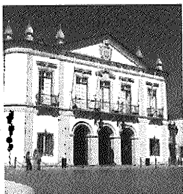
Críticas à Câmara de Faro

"Já tinha bandas pré-contratadas e pessoas contacta-