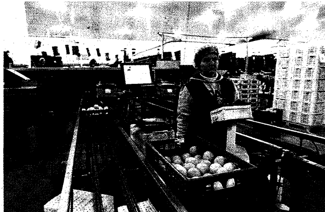
A produção local vai estar em destaque no debate organizado pela CCDR Algarve